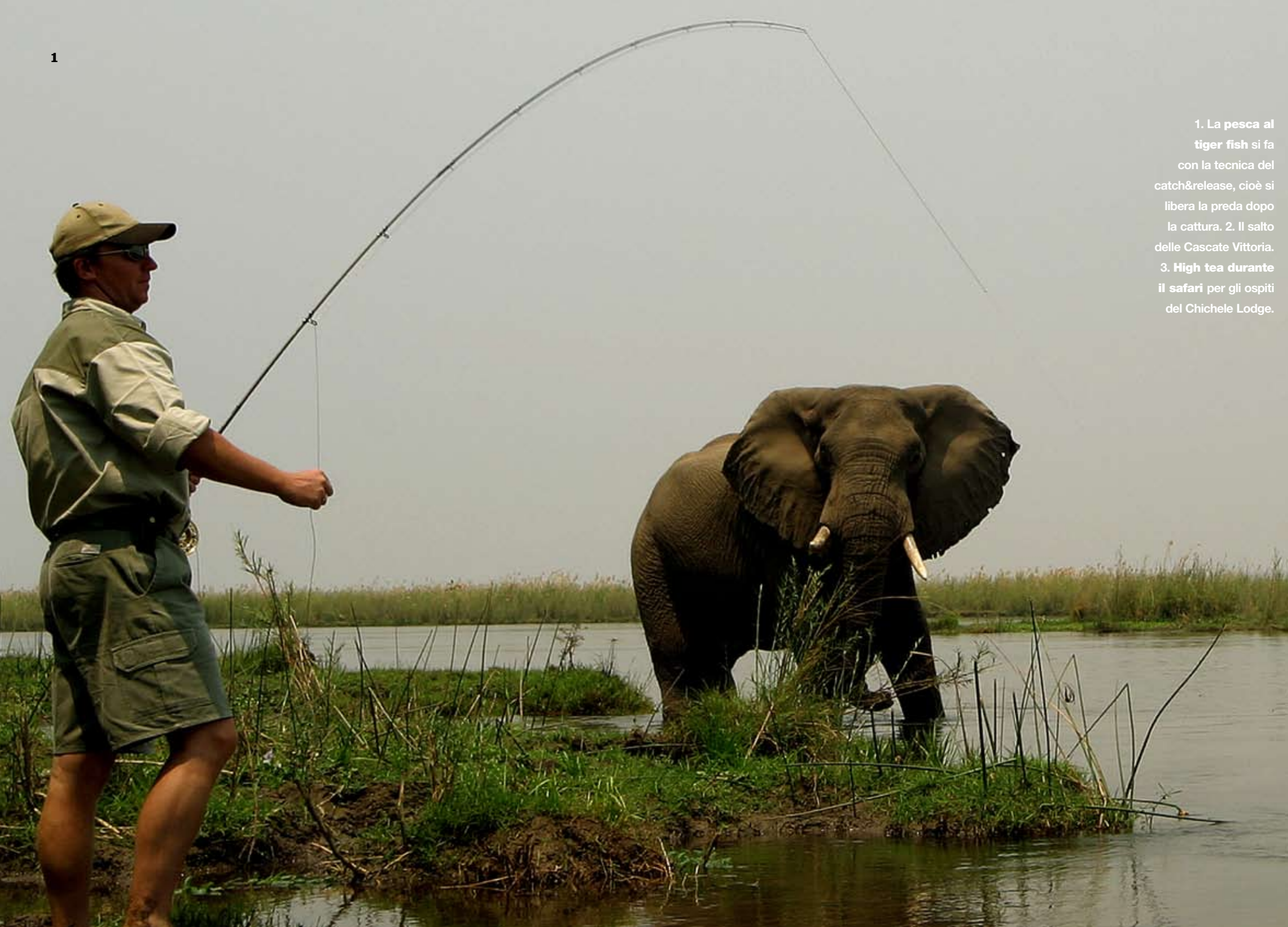
1. La pesca al tiger fish si fa con la tecnica del catch&release, cioè si libera la preda dopo la cattura. 2. Il salto delle Cascate Vittoria. 3. High tea durante il safari per gli ospiti del Chichele Lodge.