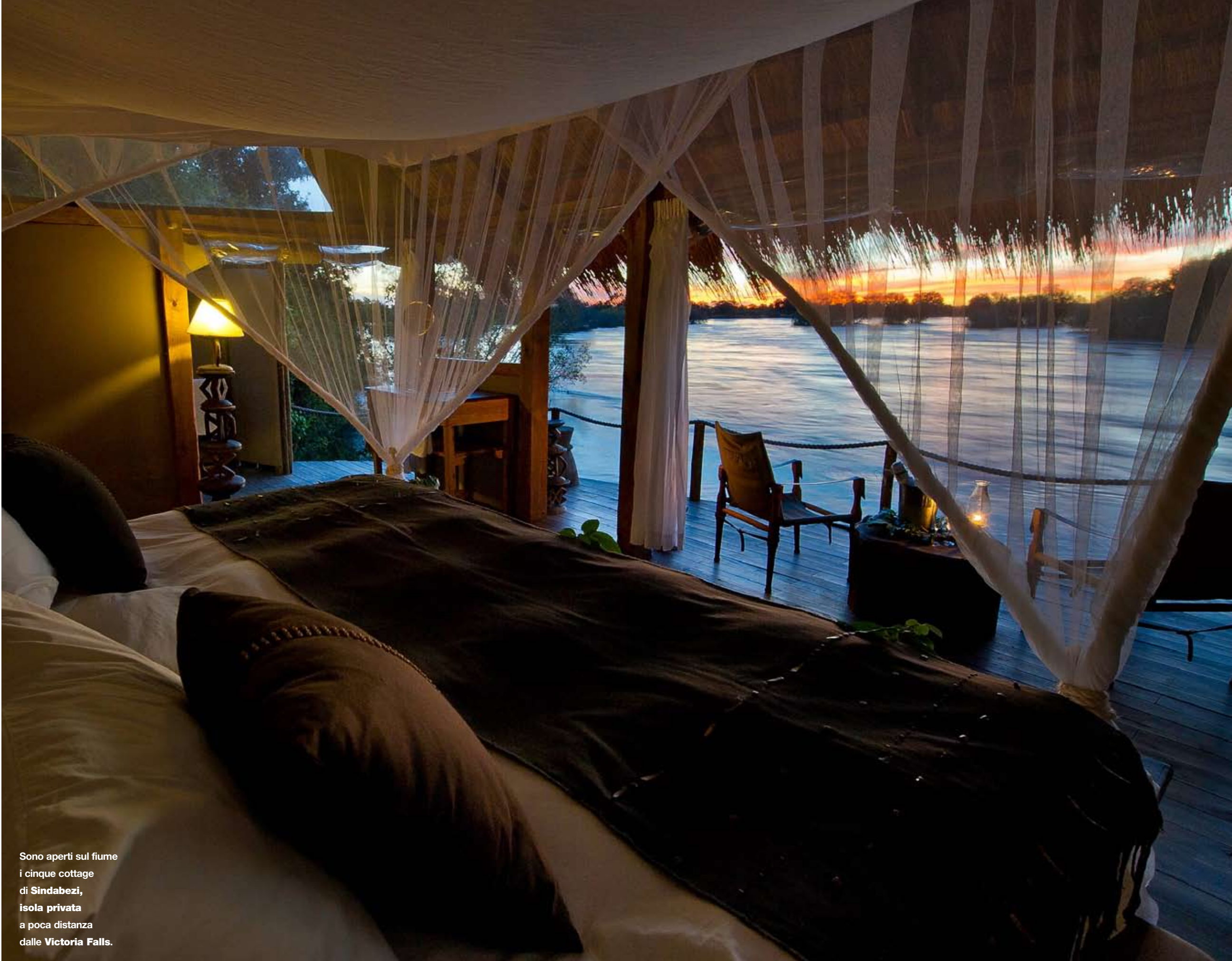
Sono aperti sul fiume i cinque cottage di Sindabezi , isola privata a poca distanza dalle Victoria Falls .

L'itinerario ideale lungo il fiume e fra i parchi inizia a Livingstone . Un avvio soft che offre fra l'altro il vantaggio di trovarsi in un posto ben organizzato, nel caso sfortunato della perdita o del ritardo del bagaglio (ci sono alcuni cambi d'aereo). Ma con lo spettacolo adrenalinico delle Victoria Falls , 110 metri di salto per 1700 metri di larghezza, luogo del mito. La lastra d'acqua verticale divide lo Zambia dallo Zimbabwe e spezza a metà la corsa di 2700 chilometri dello Zambesi dalle sorgenti all'Oceano Indiano. Nu-